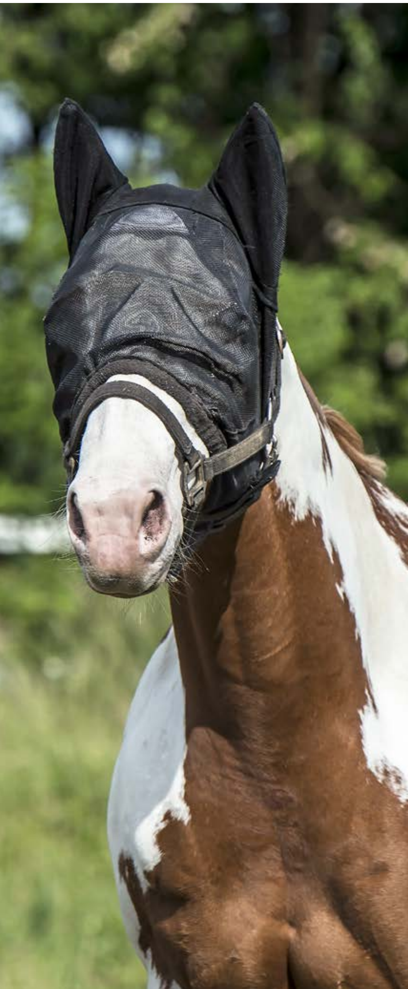
En fluemasker er god til give hesten ro, og til at minimere risikoen for øjenbetændelse eller løbende øjne på grund af generende insekter