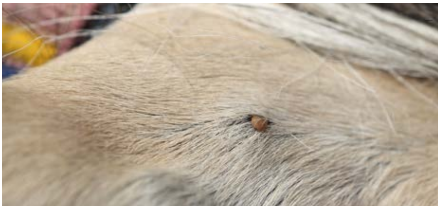
Flåter skal fjernes, og hvis området omkring et flåtbid begynder at hæve, bør man konsultere sin dyrlæge